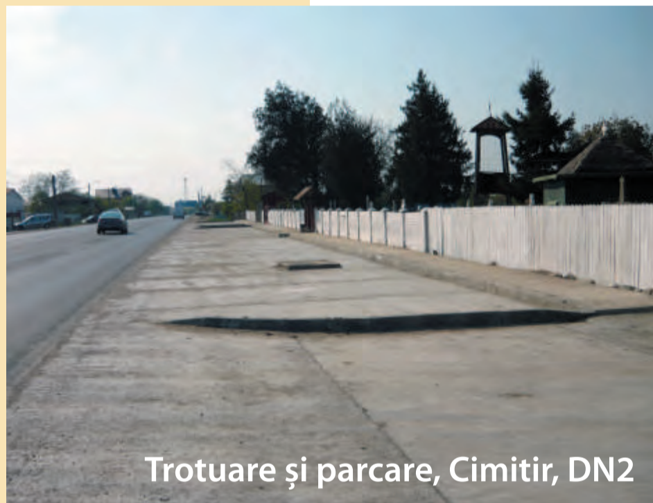
Trotuare și parcare, Cimitir, DN2