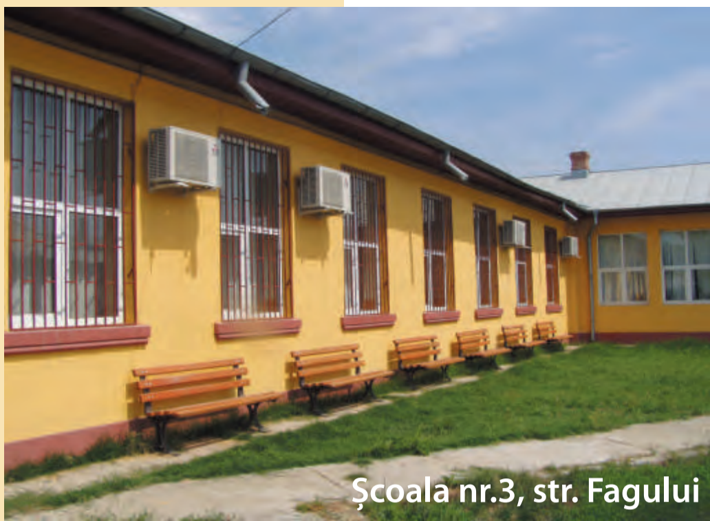
Școala nr.3, str. Fagului

construite podiști la fiecare imobil. Vreau ca locuitorii comunei Afumați să știe că primarul Dumănică face lucruri trainice și de calitate pentru că trebuie să profităm la maximum de sumele de bani de care dispunem.