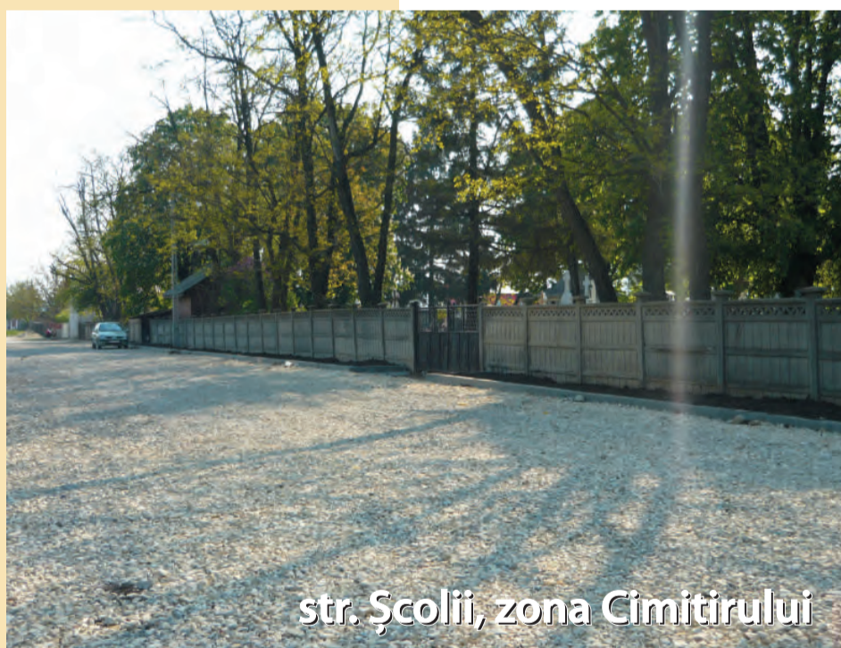
str. Școlii, zona Cimitirului