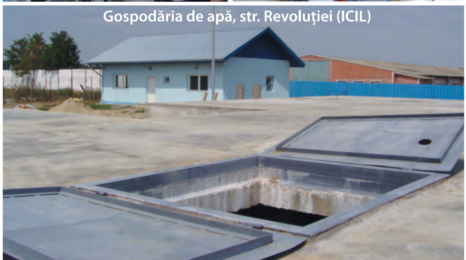
Gospodăria de apă, str. Revoluției (ICIL)