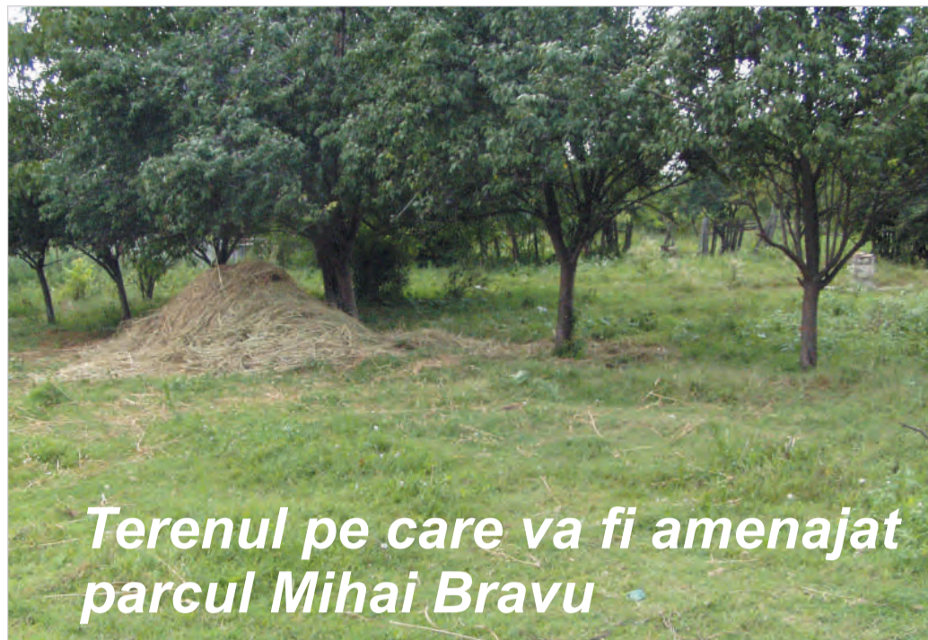
Terenul pe care va fi amenajat parcul Mihai Bravu

În cursul primei săptămâni din luna octombrie, cu ajutorul unei sponsorizări venită din partea firmei de gaze Mega Construct, în valoare de 4 000 lei, au fost achiziționate scaune pentru școli.